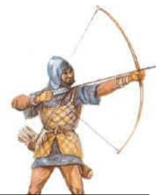
Pfeil und Bogen

Hier sichten wir verschiedene Quellen. Zeitzeugenberichte, Dokumentationen, Bilder und ähnliches.